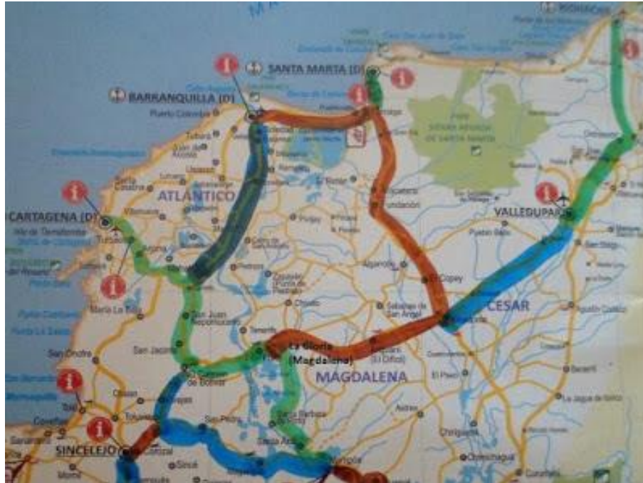
Mapa partiendo desde las ciudades del Caribe

Estas fotos y escritos son de la autoría de Arnoldo Toscano y Alfredo Domínguez