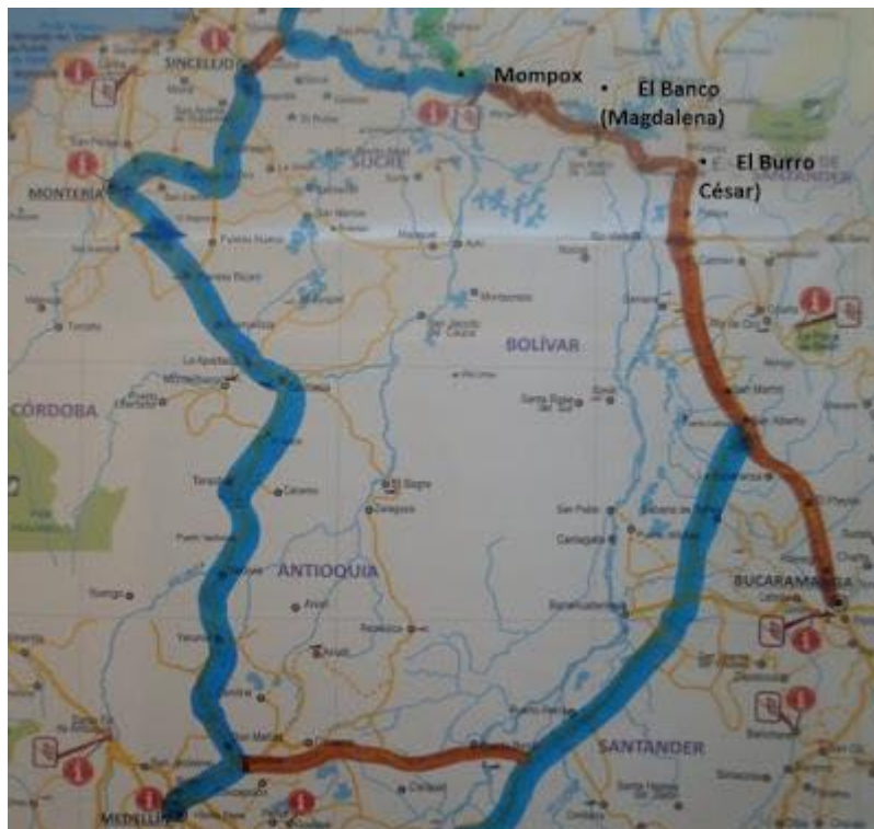
Mapa partiendo desde Medellin y Bucaramanga

De Bucaramanga la empresa de buses que viaja al Banco es Cootrans Magdalena.